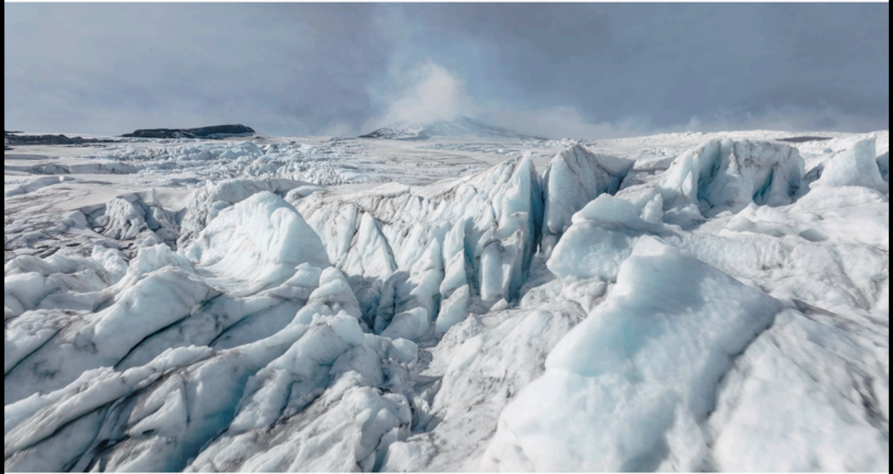
Glaciar Wajpi, cercano al volcán Ruapehu en la zona de la región de la Antártida, Chile. (20-05-2015, 17:34:12)

Los glaciares son la reserva de agua dulce más importante de nuestro planeta, son imprescindibles dentro del ciclo hidrológico (2-3% de reservas de agua en el planeta corresponden a agua dulce y entre del 70% está almacenada en glaciares). En Chile existen cerca de 20 mil glaciares y son el 80% de los glaciares de Sudamérica, estos se encuentran en peligro por los efectos del cambio climático y las actividades de la industria minera.